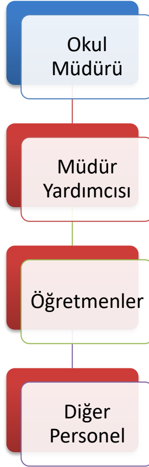
Şekil 1. Kelleci Ortaokulu Teşkilat Şeması

Babadağ Kelleci Ortaokulu Müdürlüğü 14/09/2011 tarih ve 28054 sayılı Kanununun 652 sayılı kararname ile yönetim ve organizasyon yapısı belirlenmiş olup iş ve işlemlerini bu kanun doğrultusunda yürütmektedir.